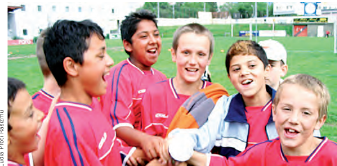
Ludlia Proti Rassismu

L'UISP si è conquistata un ruolo importante all'interno della rete FARE grazie alla gestione delle relazioni istituzionali sia a livello nazionale che europeo, all'essere parte attiva nella promozione e realizzazione di congressi e dibattiti e alla promozione della lotta contro la discriminazione anche negli altri sport, attraverso i propri canali associativi. Recentemente la UISP ha avuto l'incarico di coordinare una serie di progetti extraeuropei grazie al contributo della Fifa.